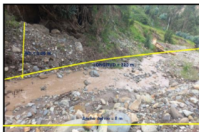
VISTA N° 3: SECTOR 5 MARGEN DERECHA Y DEL RIO LLOCLLA – ACO CON PUNTO INICIAL E= 227136.00; N= 8933178.00 Y PUNTO FINAL E= 226940.00; N= 8933070.00, DONDE SE REALIZARA LA CONFORMACION DE BORDO