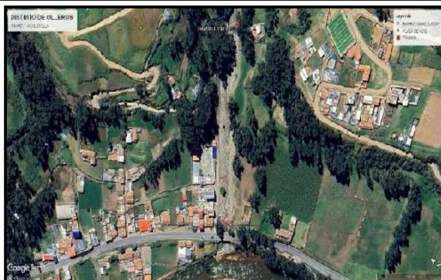
VISTA N° 1: TRAMO GENERAL DEL MARGEN DEL RIO LLOCLLA – ACO CON PUNTO INICIAL E= 227136.00; N= 8933178.00 Y PUNTO FINAL E= 226940.00; N= 8933070.00