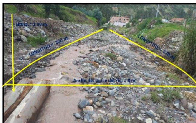
VISTA N° 5: SECTOR 1 MARGEN DERECHA DEL RIO LLOCLLA - ACO CON PUNTO INICIAL E= 227136.00; N= 8933178.00 Y PUNTO FINAL E= 226940.00; N= 8933070.00, DONDE SE REALIZARA LA CONFORMACION DE BORDO