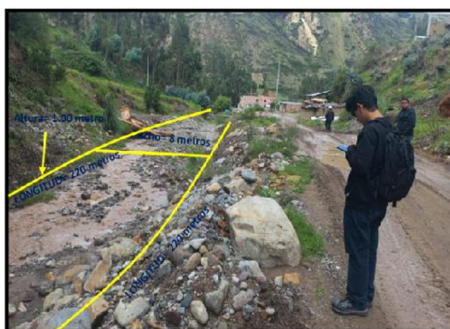
VISTA N° 2: RIO LLOCLLA – ACO CON PUNTO INICIAL E= 227136.00; N= 8933178.00 Y PUNTO FINAL E= 226940.00; N= 8933070.00, DONDE SE REALIZARA LA DESCOLMATACION DE MATERIAL DE ARRASTRE