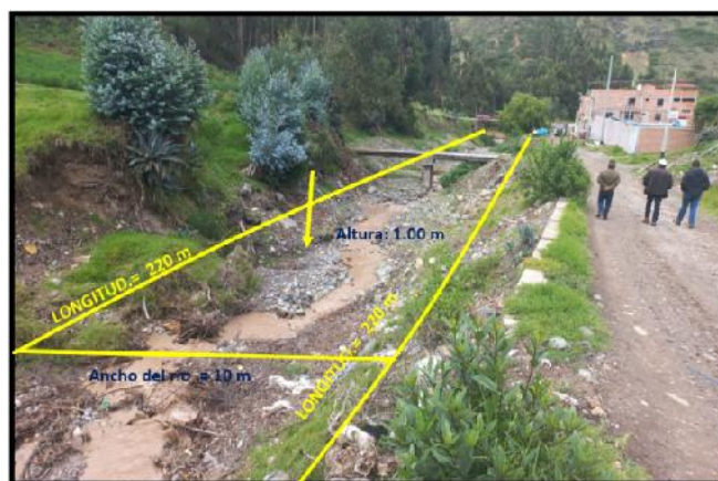
VISTA N° 6: SECTOR 1 MARGEN DERECHA DEL RIO LLOCLLA - ACO CON PUNTO INICIAL E= 227136.00; N= 8933178.00 Y PUNTO FINAL E= 226940.00; N= 8933070.00, DONDE SE REALIZARA LA CONFORMACION DE BORDO