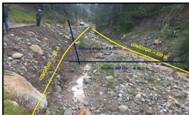
VISTA N° 4: SECTOR 5 MARGEN DERECHA DEL RIO LLOCLLA - ACO CON PUNTO INICIAL E= 227136.00; N= 8933178.00 Y PUNTO FINAL E= 226940.00; N= 8933070.00, DONDE SE REALIZARA LA CONFORMACION DE BORDO